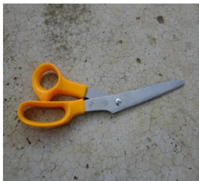
ภาพที่ 10:ภาพการใช้กรรไกรตัดแต่งใบและรากเก่าของหัวหอมพันธุ์