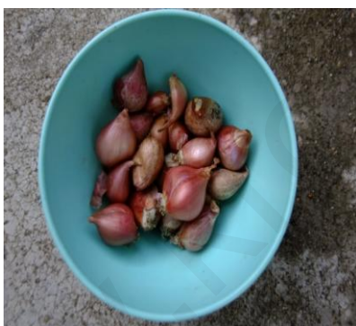
ภาพที่ 16 ภาพหอมแดงที่ตัดแต่งเรียบร้อยแล้ว พร้อมจะนำไปปลูก

3. การปลูก ก่อนปลูกควรรดน้ำในกระถางปลูกให้ดินชุ่มชื้นไว้ล่วงหน้า นำหัวหอมพันธุ์มาปลูกลงในกระถางโดยเอาส่วนโคนหรือที่แคบที่ออกรากเก่าจิ้มลงไปดินประมาณครึ่งหัว ระวังอย่ากดแรงนักจะทำให้ลำต้นหรือรากหักจะทำให้ไม่งอก หรือออกรากช้า เมื่อปลูกให้คลุมด้วยฟาง