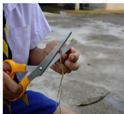
ภาพที่ 15:ภาพใช้กรรไกรตัดใบเก่าและราก หอมแดงที่จะปลูกออกก่อนนำไปปลูก