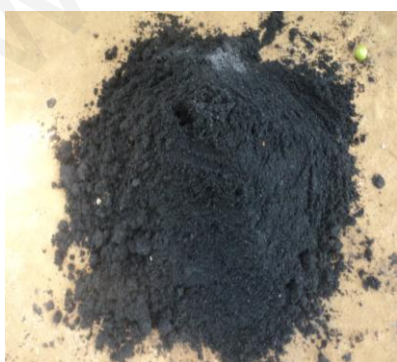
ภาพที่ 5:ภาพแกลบดำ

1.3 แกลบดำ ใช้เป็นส่วนผสมดินปลูกหอมแดงโดยการนำเอาแกลบมาเผาให้ไหม้มีสีดำ