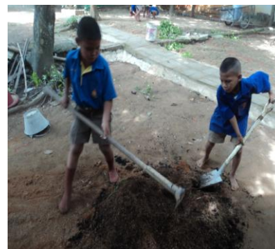
ภาพที่ 11: ภาพการใช้จอบคลุกเคล้า ส่วนผสมดินปลูก