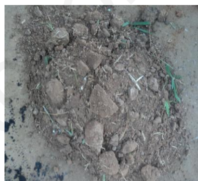
ภาพที่ 4: ภาพดินร่วน

1.3 แกลบดำ ใช้เป็นส่วนผสมดินปลูกหอมแดงโดยการนำเอาแกลบมาเผาให้ไหม้มีสีดำ