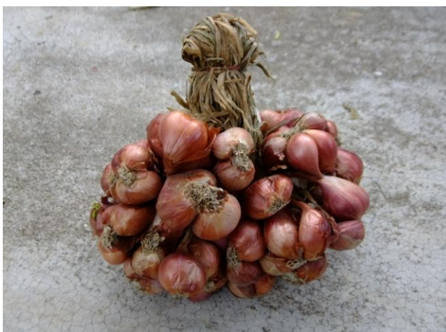
ภาพ 1 : ภาพหอมแดง