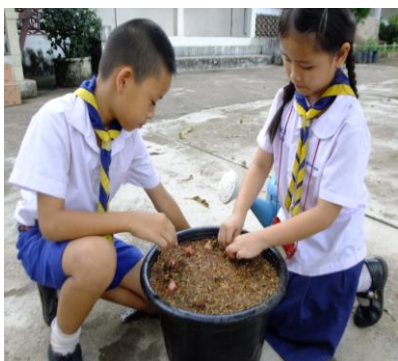
ภาพที่ 16:ภาพปลูกหอมแดง

หรือหญ้าแห้งหรือเกลบนานาพอสมควรเป็นการ รักษาความชุ่มชื้นและคุมวัชพืช จากนั้นรดน้ำให้ชุ่ม ๆ ต้นหอมจะงอกออกมาภายใน 7-10 วัน หากยังไม่ ทำการปลูกซ่อมทันที