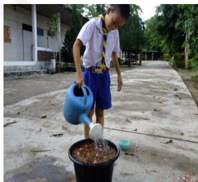
ภาพที่ 17 : ภาพการรดน้ำเมื่อปลูกเสร็จ ที่มา: จรวพร ปัญญาดา(2556)