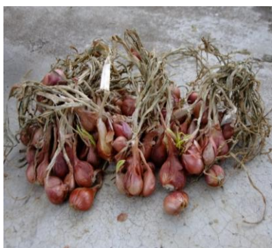
ภาพที่ 3:ภาพหอมแดงที่จะนำมาปลูก

1.2 ดินร่วน ใช้เป็นส่วนผสมของแกลบดำ ขุยมะพร้าว และปุ๋ยคอก เพื่อปลูกหัวหอม