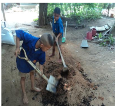
ภาพที่ 13:ภาพคลุกส่วนผสมดิน ปลูกเข้าด้วยกัน

เตรียมดินปลูกหอมแดง โดยใช้ดินร่วนที่เป็นวัสดุหลัก ผสมกับเกลบดำขุยมะพร้าว และปุ๋ยคอก ในอัตราส่วน 2:1:1:1 คลุกเคล้าส่วนผสมให้เข้ากัน ตักใส่ลงในกระถางใช้เพื่อเตรียมการปลูกหัวหอมแดง