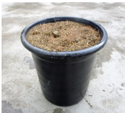
ภาพที่ 14:ภาพใส่ดินปลูกลงในกระถางให้เต็ม