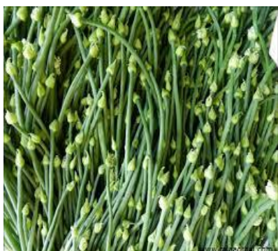
ภาพที่ 2: ภาพลักษณะของดอกหอมแดง