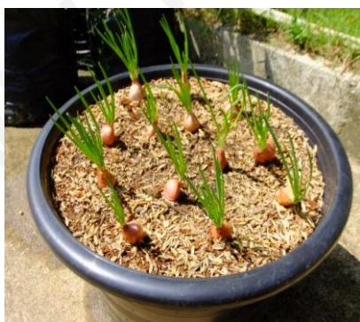
ภาพที่ 18:ภาพหอมแดงเริ่มงอกใบ