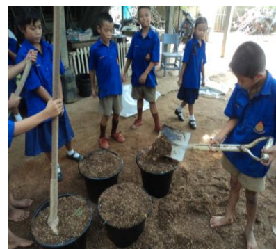
ภาพที่ 12: ภาพพลั่ว