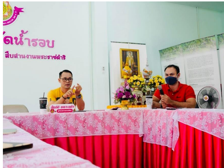
ภาพที่ 9 การแลกเปลี่ยนเรียนรู้ กับผู้บริหาร