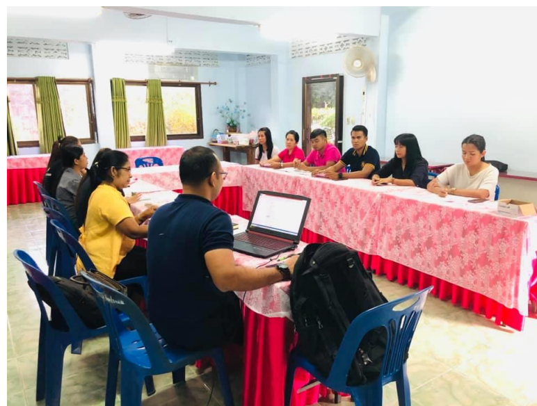
ภาพที่ 10 การแลกเปลี่ยนเรียนรู้ กับคณะครูโรงเรียนวัดน้ำรอบ