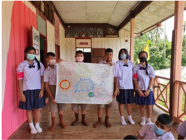
ภาพที่ 5 ภาพชิ้นงานนักเรียน