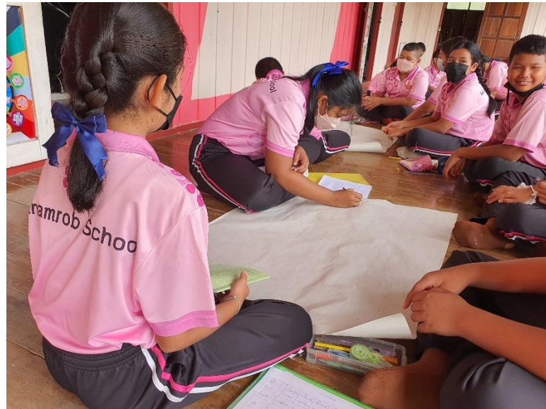
ภาพที่ 1 บรรยากาศการทำกิจกรรมของนักเรียน