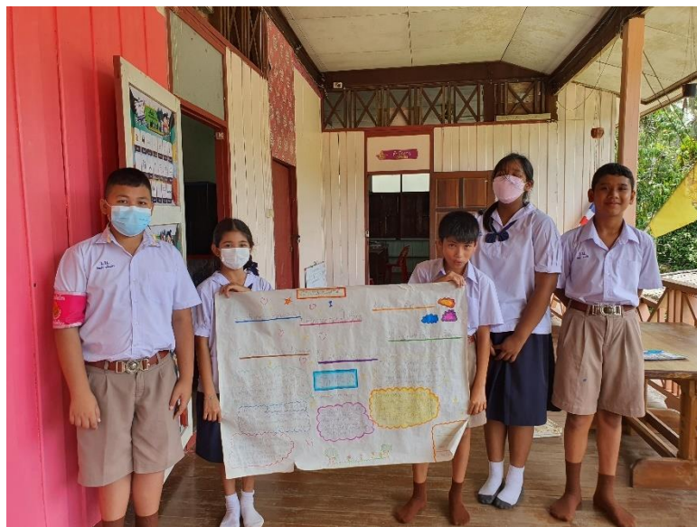
ภาพที่ 6 ภาพชิ้นงานนักเรียน