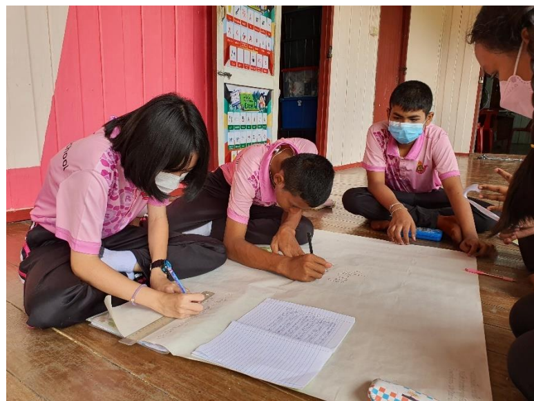
ภาพที่ 2 บรรยากาศการทำกิจกรรมของนักเรียน