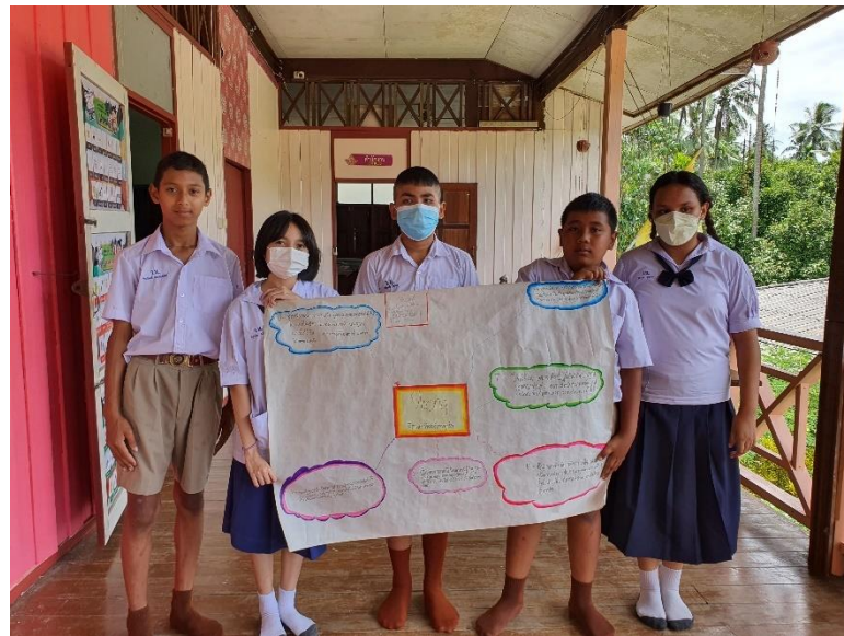
ภาพที่ 7 ภาพชิ้นงานนักเรียน