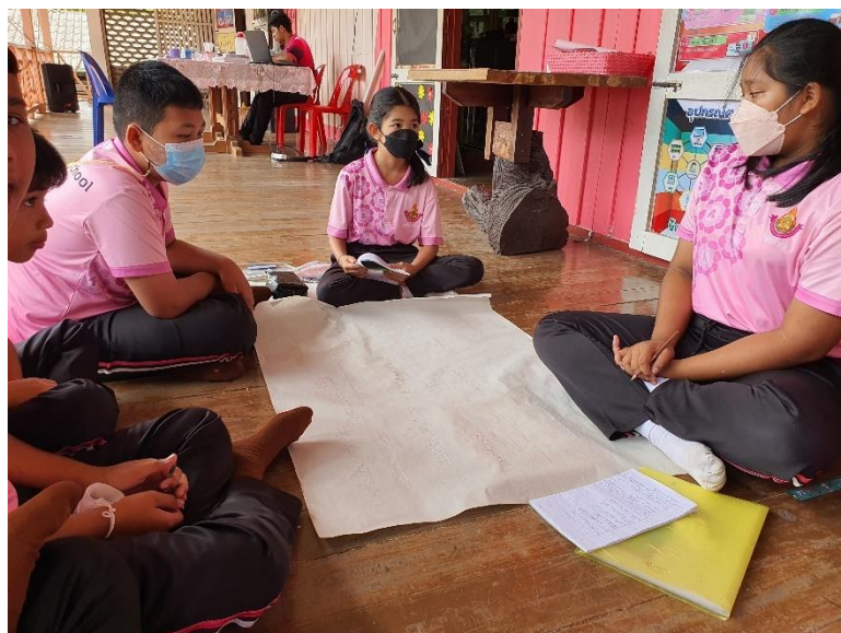
ภาพที่ 4 บรรยากาศการทำกิจกรรมของนักเรียน