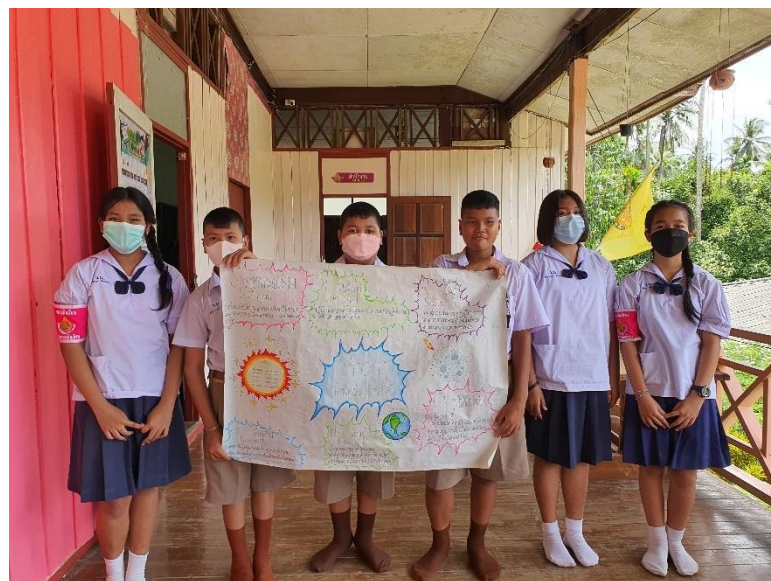
ภาพที่ 8 ภาพชิ้นงานนักเรียน