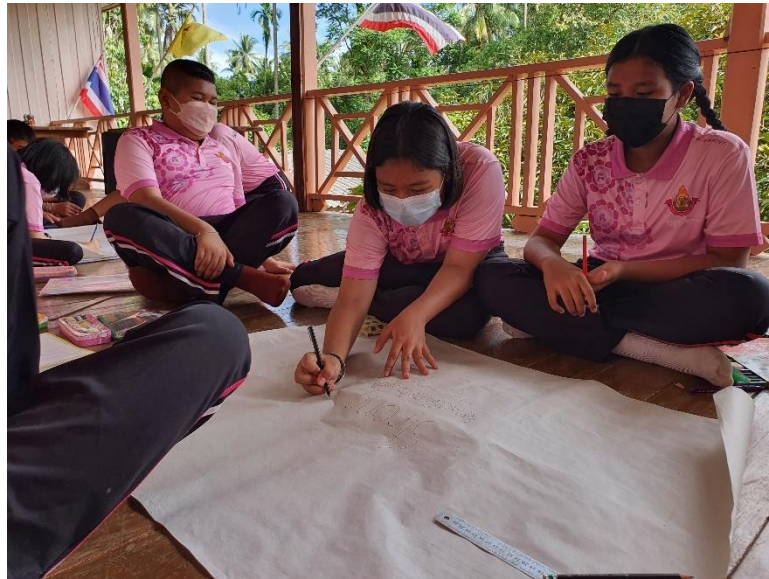
ภาพที่ 3 บรรยากาศการทำกิจกรรมของนักเรียน