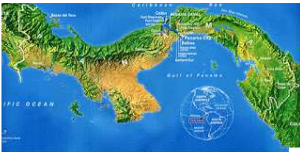
ภาพคลองปานามา

ดินแดนใต้สุด ได้แก่ บริเวณทางตะวันออกเฉียงใต้ของประเทศปานามา