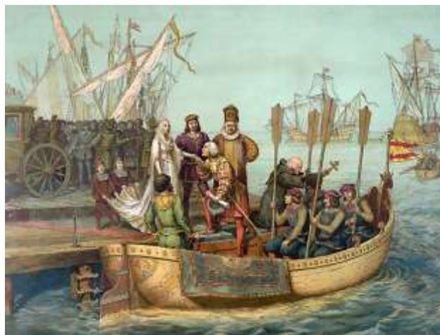
ภาพวาดคริสโตเฟอร์ โคลัมบัสและลูกเรือเดินทางไปสเปน

คริสโตเฟอร์ โคลัมบัส (Christopher Columbus) นักสำรวจชาวอิตาลีค้นพบทวีปอเมริกาในยุคใหม่ เสียชีวิต โคลัมบัสเกิดที่เมืองเจนัว ประเทศอิตาลีเมื่อปี 1494 ในสมัยนั้นผู้คนยังเชื่อว่าโลกแบน แต่โคลัมบัสต้องการค้นหาดินแดนแห่งเครื่องเทศและผ้าไหม ที่เรียกว่าอินเดียและจีน เขาจึงเสนอเป็นผู้สำรวจดินแดนดังกล่าวให้กับกษัตริย์โปรตุเกสแต่ไม่สำเร็จ จึงเดินทางไปประเทศสเปนและเสนอต่อ พระเจ้าเฟอร์ดินานด์ ที่ 2 (Ferdinand II of Aragon) และ พระนางอิสซาเบลลา ที่ 1 (Isabella of Castile) เพื่อออกสำรวจอินเดียและจีน เพื่อทำการค้าเครื่องเทศและผ้าไหม ในที่สุด เมื่อวันที่ 3 สิงหาคม 1492 โคลัมบัสและลูกเรือ 90 คนและเรืออีก 3 ลำออกเดินทางค้นหาทวีปเอเชียและจีน โดยแล่นเรือไปทางทิศตะวันตกข้ามมหาสมุทรแอตแลนติก และไปถึง เกาะบาฮามาส (Bahamas) ทางตะวันออกของฟลอริดา ประเทศสหรัฐอเมริกา ปัจจุบัน และตั้งชื่อว่า "ซาน ซัลวาดอร์" (San Salvador) เมื่อวันที่ 12 ตุลาคม 1492 ซึ่งเขาคิดว่าเป็นส่วนหนึ่งของเอเชีย จากนั้นเขาเดินทางต่อไปจนถึงคิวบา ฮิสปันโโอลา เปอร์โตริโก จาเมกา ตรินิแดด เวเนซุเอลา และคอคอดปานามา โคลัมบัสเชื่อมาตลอดจนเสียชีวิตว่าดินแดนที่เขาค้นพบนั้นคือทวีปเอเชีย ภายหลังได้มีการกำหนดให้วันที่ 12 ตุลาคมของทุกปี ซึ่งเป็นวันที่โคลัมบัสมาถึงอเมริกาเป็น "วันโคลัมบัส" มีการเฉลิมฉลองกันในสหรัฐอเมริกาและประเทศต่าง ๆ ในทวีปอเมริกาใต้