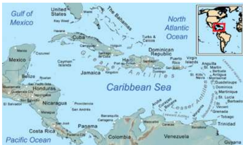
ภาพหมู่เกาะเวสต์อินดีส