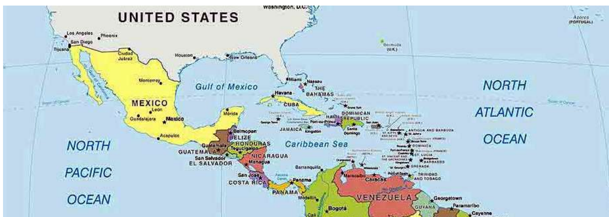
ภาพภูมิภาคลาตินอเมริกา