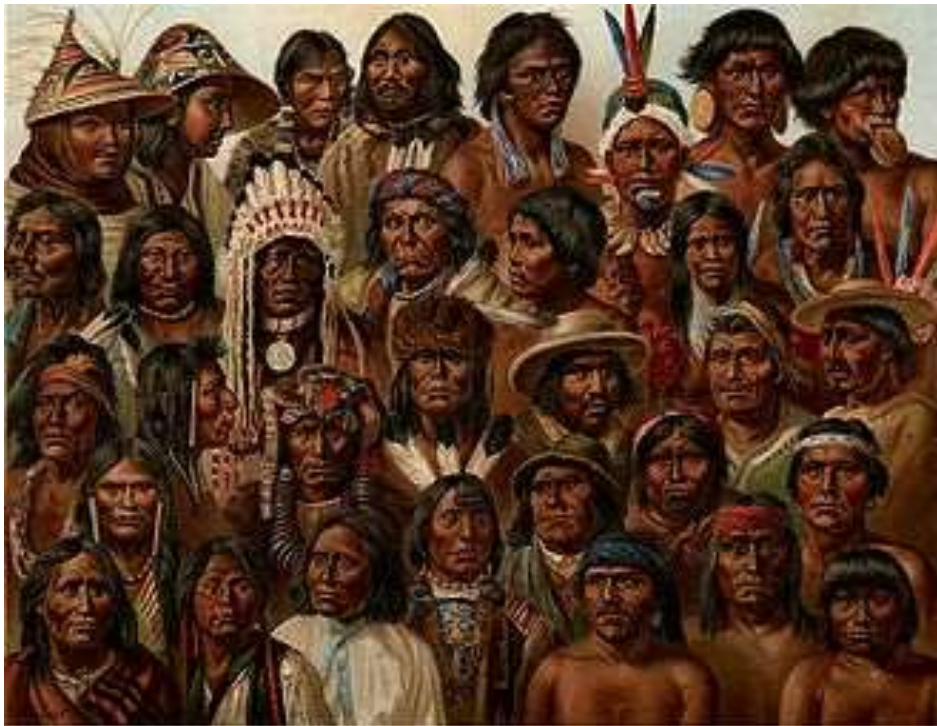
ภาพวาดชาวอเมริกัน – อินเดียน ชาวพื้นเมืองของทวีปอเมริกาเหนือ

ทวีปอเมริกาเหนือได้ชื่อว่า “ดินแดนโลกใหม่” เนื่องจากชาวยุโรปได้สำรวจและตั้งถิ่นฐานเมื่อประมาณ 500 ปีที่ผ่านมา แต่พบว่ามีชนชาวเอเชียอพยพผ่านเข้าไปในอเมริกาเหนือทาง ช่องแคบแบริง เมื่อประมาณ 35,000 – 12,000 ปีก่อนคริสต์ศักราช ซึ่งคือชาว อเมริกัน – อินเดียน โดยมีการค้นพบเครื่องมือหินเป็นหลักฐาน ต่อจากนั้นมีการอพยพลงได้ทำให้เริ่มมีชนเผ่าพื้นเมืองตั้งแต่เหนือสุดลงไปสู่ทางทิศใต้ของอเมริกาเหนือ