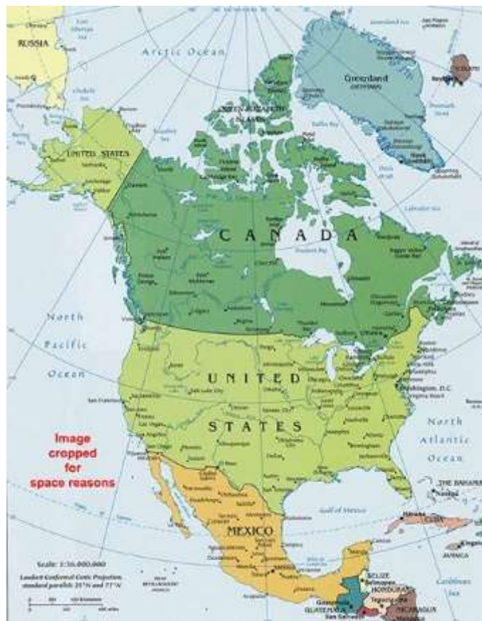
ภาพทวีปอเมริกาเหนือ

➡ ขนาด ทวีปอเมริกาเหนือมีพื้นที่ประมาณ 22,063,997 ตารางกิโลเมตร เป็นทวีปที่มีขนาดใหญ่เป็น อันดับ 3 ของโลก รองจากทวีปเอเชียและแอฟริกาตามลำดับ บริเวณที่กว้างที่สุดของทวีป คือ ตั้งแต่ช่อง แคบเบริงถึงเกาะนิวฟันด์แลนด์ ส่วนบริเวณที่ยาวที่สุดของทวีป คือ ตั้งแต่คาบสมุทรบูเทียถึงคอคอดปานามา ซึ่งเป็นส่วนที่แคบที่สุดของทวีป คือ กว้างประมาณ 74 กิโลเมตร ทวีปอเมริกาเหนือ มีรูปร่างคล้ายสามเหลี่ยม หัวกลับ คือ มีฐานกว้างอยู่ทางด้านเหนือของปลายแหลมอยู่ทางตอนใต้