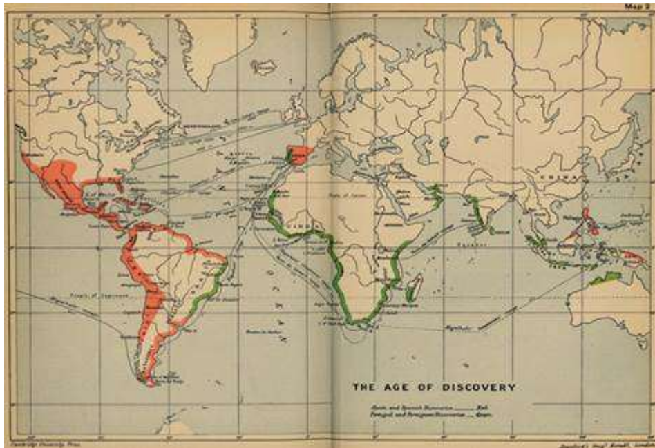
แผนที่เดินเรือชาวยุโรปหรือพวกไวกิง