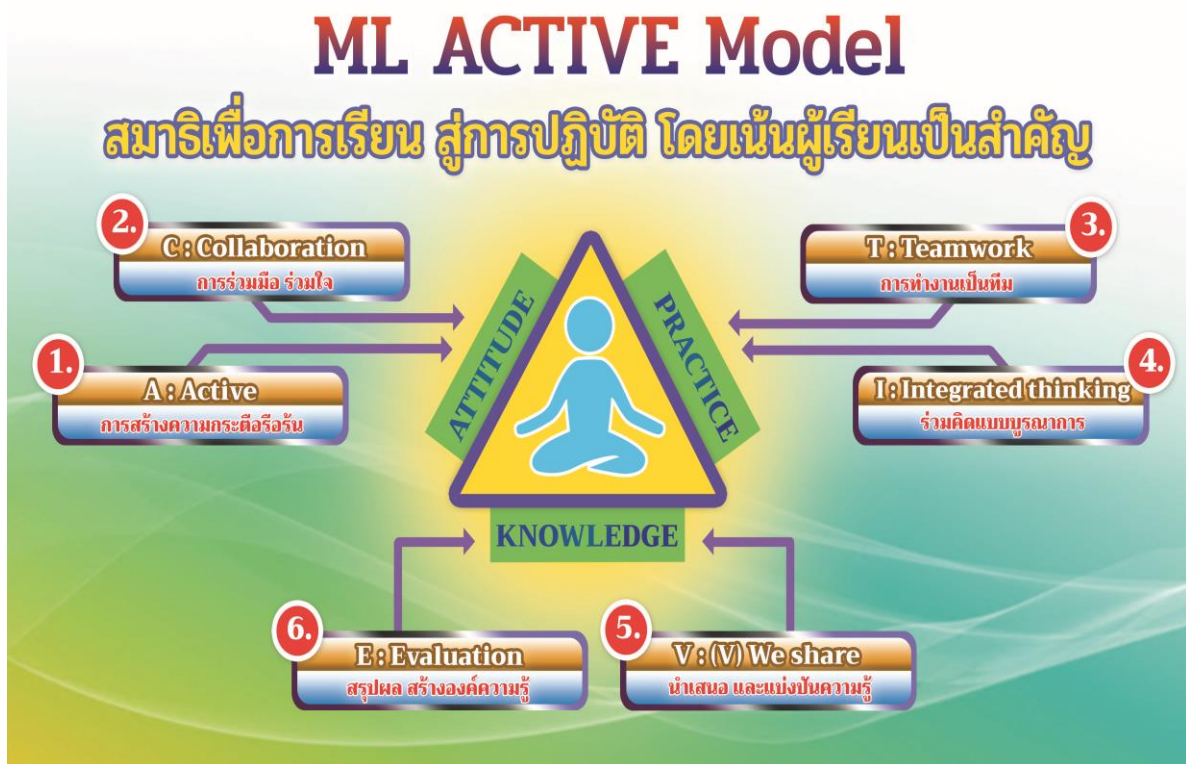
ภาพที่ ๒ แสดง ML ACTIVE Model ของโรงเรียนวัดบ้านดง