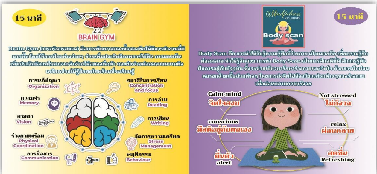
ภาพที่ ๓ แสดงองค์ประกอบของกิจกรรมของ brain gym และ body scan