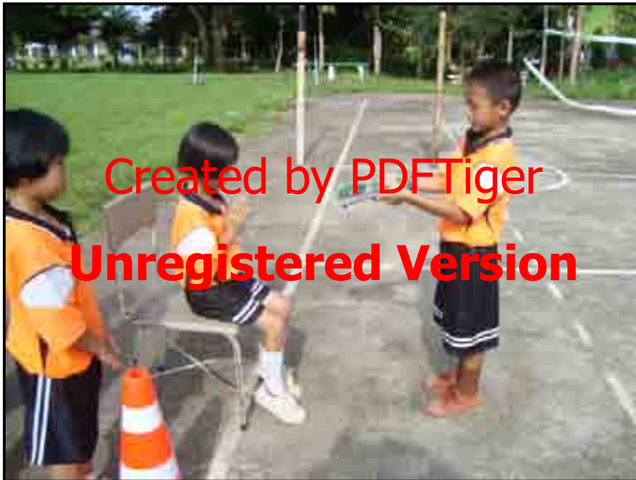
ทำที่ 4 การนั่งและยืน โดยมีอุปกรณ์ประกอบ ที่มา : (วารสารณ พงษ์มณี : 2552)