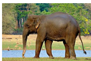
“ช้าง” สัตว์ประจำชาติประเทศลาว

ฝูงหนึ่งอาจมากถึง 20 ตัว อนุรักษ์จัดว่าเป็นสัตว์เสี่ยงลูกด้วยนมที่พบเห็นได้ยากที่สุดชนิดหนึ่งของโลก พบได้ทางเหนือของประเทศกัมพูชา ทางใต้ของลาว ทางตะวันตกของเวียดนาม และทางตะวันออกของไทย ปัจจุบันไม่มีการรายงานการพบมานานแล้ว เชื่อว่าอาจจะยังพอมีหลงเหลืออยู่ในชายแดนไทยกับกัมพูชาแถบจังหวัดศรีสะเกษ ราวปี พ.ศ.2507 มักจะมีข่าวว่าพบสัตว์ลักษณะคล้ายกูบรีอยู่บ่อยๆ แต่ก็ยังไม่มีหลักฐานยืนยันที่น่าเชื่อถือพอ นอกจากคำเล่าลือเท่านั้น