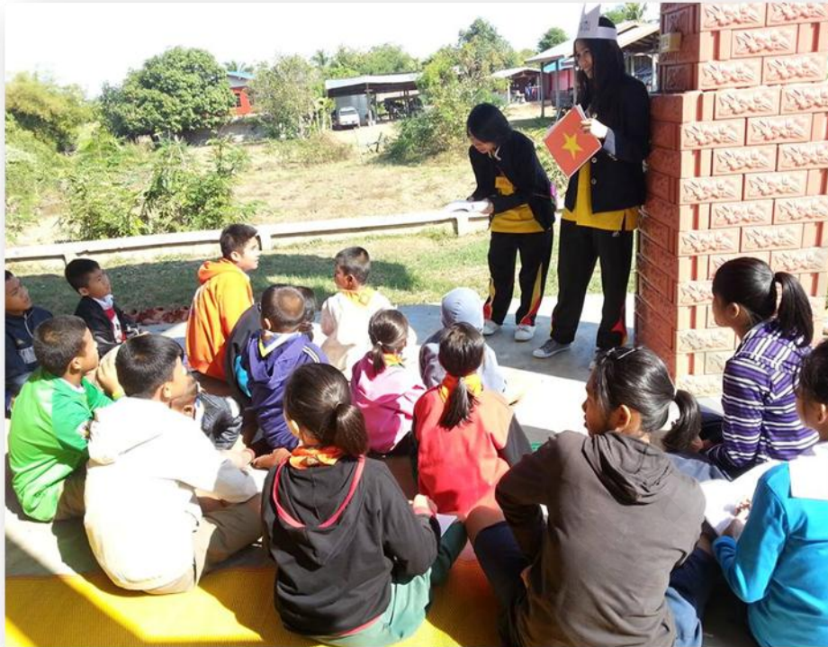
ทั้งพี่ๆน้องๆต่างตั้งใจกันอย่างเต็มที่