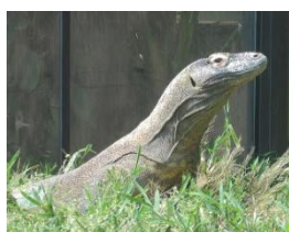
“มังกรโคโมโด” สัตว์ประจำชาติอินโดนีเซีย

“เสือ” เป็นสัตว์ประจำชาติของประเทศเมียนมาร์ ลักษณะของเสือสามารถบ่งบอกได้ถึงความอุดมสมบูรณ์ของประเทศเมียนมาร์