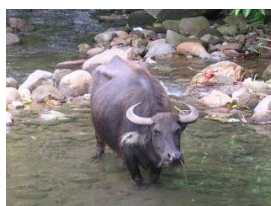
“กระบือ” สัตว์ประจำชาติฟิลิปปินส์

“มังกรโคโมโด” เป็นสัตว์ประจำชาติอินโดนีเซีย มังกรโคโมโดเป็นสัตว์เลื้อยคลานจำพวกกิ้งก่า (มีขนาดใหญ่ที่สุดในโลก) มังกรโคโมโดถือเป็นสัตว์เลื้อยคลานใกล้สูญพันธุ์ สามารถพบได้เฉพาะบนเกาะโคโมโด (Komodo Island) ซึ่งเป็นเกาะเล็กๆ ที่ไม่มีคนอาศัยอยู่ เนื่องจากเป็นเกาะภูเขาไฟกลางทะเล