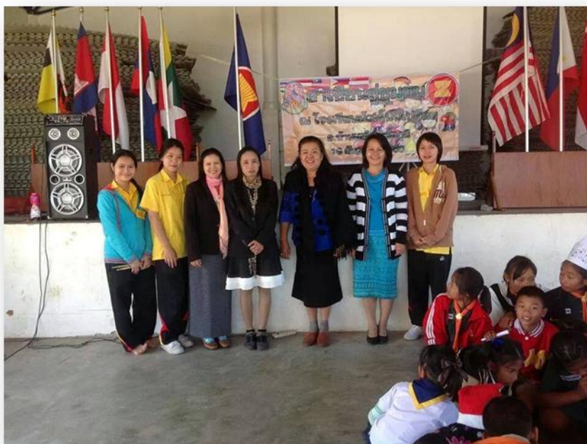
คณะครูนักเรียนร่วมกันถ่ายภาพก่อนปิดค่าย