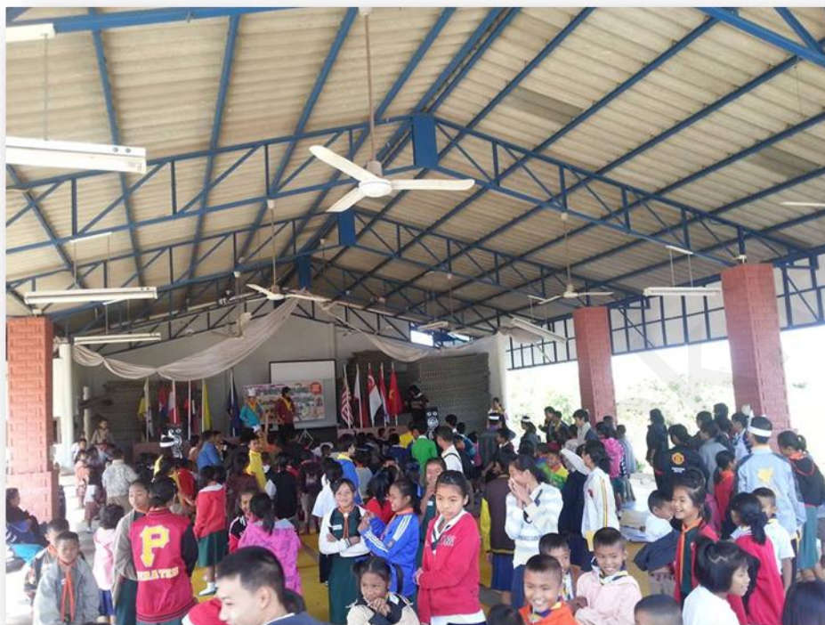
กิจกรรมนันทนาการ