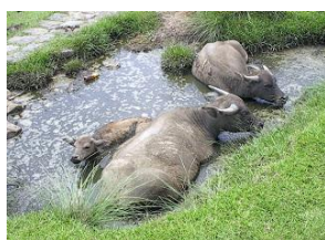
“กระบือ” สัตว์ประจำชาติประเทศเวียดนาม

“ช้าง” เป็นสัตว์ประจำชาติประเทศลาว ช้างถือเป็นสัตว์คู่บ้านคู่เมืองที่มีความผูกพันกับชาวลาวเป็นอย่างยิ่ง ในอดีตลาวได้รับการเรียกขานว่าเป็นเมืองล้านช้าง แต่ปัจจุบันประชากรช้างในลาวอยู่ในภาวะวิกฤต รัฐบาลลาวจึงได้ฟื้นฟูและอนุรักษ์ช้างลาวไว้ โดยการจัดงานบุญช้างขึ้นเป็นประจำทุกปี