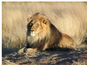
“สิงโต” สัตว์ประจำชาติของประเทศสิงคโปร์