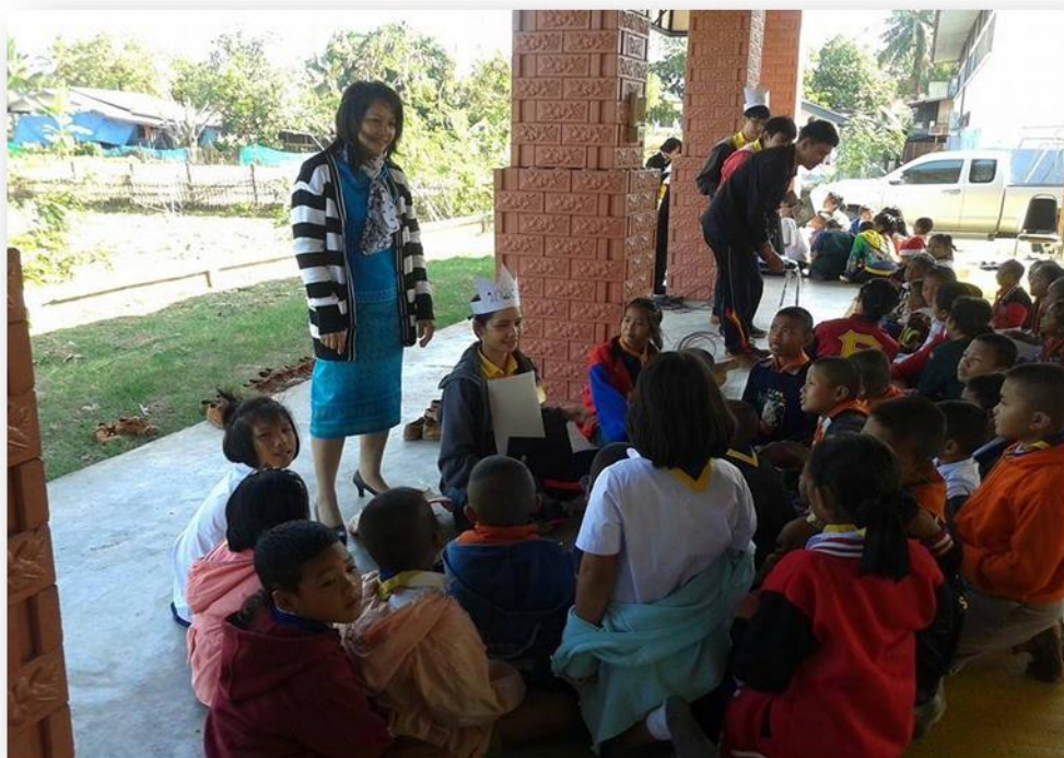
คุณครูที่ปรึกษาร่วมกิจกรรมกับนักเรียน