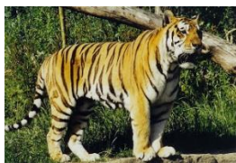
“เสือ” สัตว์ประจำชาติของประเทศเมียนมาร์