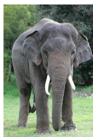
“ช้าง” สัตว์ประจำชาติไทย

เมียนมาร์ กัมพูชา เวียดนาม สิงคโปร์ มาเลเซีย อินโดนีเซีย ฟิลิปปินส์ และบรูไน ส่วนประเทศไทยจะมีสัตว์ชนิดใดเป็นสัตว์ประจำชาติกันบ้างนั้น ตามไปอ่านกันเลย