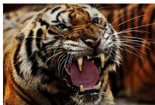
“เสือโคร่ง” สัตว์ประจำชาติบรูไน