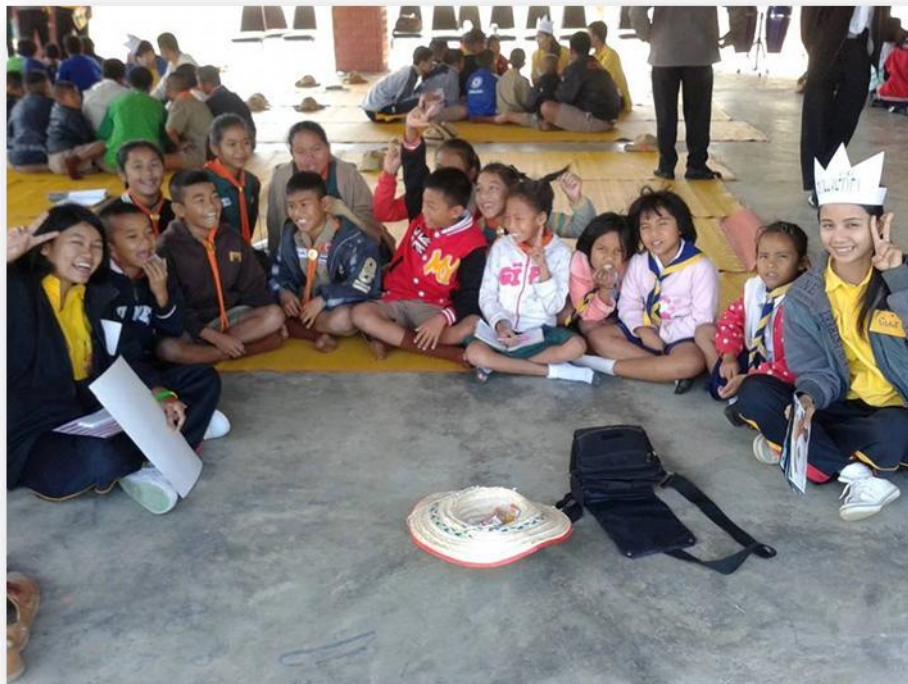
ถ่ายรูปกันหน่อย ยิ้มๆ